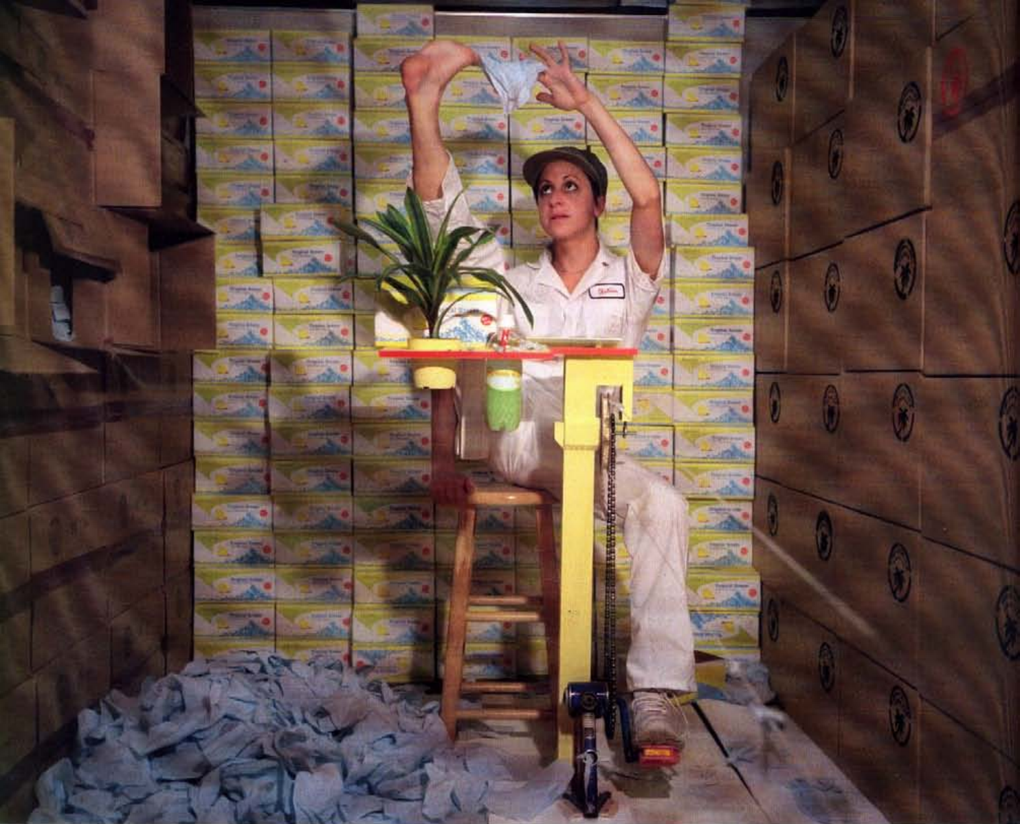
Erfrischungstücher Marke „Tropische Brise“ aus dem Schweiß einer farbigen Lastwagenfahrerin: „Tropical Breeze“ von 2004

E s gehört einiges an Frechheit dazu, der legendären New Yorker Galeristin Mary Boone einen Würfel aus zusammengepressten Salatblättern, Gummi und zerstampftem Puderrouge in die Hand zu drücken. Das unansehnliche Stück als Kunst zu erklären und Lady Boone damit wie die Moderatorin einer Einkaufs-show zu fotografieren. Boone galt in den achtziger Jahren als Königin der New Yorker Kunstwelt. Wie niemand sonst verstand sie es, die Preise für ihre Künstler nach oben zu treiben. Und wie keine andere wurde sie 1990, als die Geschäfte zusammenbrachen, für ihre Rolle als aggressive Vermarkterin der Kunst kritisiert.