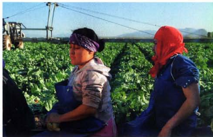
Eisbergsalat aus Arizona, asiatische Handmassage und ausgequetschtes Wangenrot: Videoinstallation „Squeeze“ von 2010